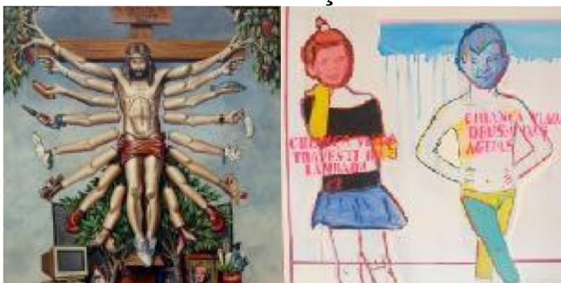
Figura 01 e 02 - Cruzando Jesus Cristo Deusa Schiva e Criança Viada