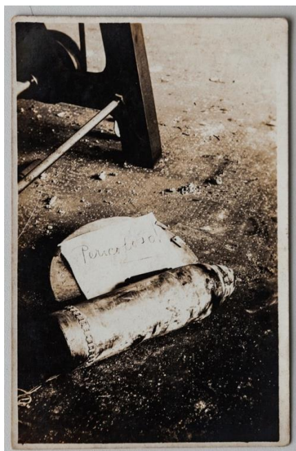
Figura 4: Autoria desconhecida, Granada que não explodiu na Fábrica Crespi , São Paulo, 1924.

Fonte: Acervo Fundação Energia e Saneamento, São Paulo, 2015.