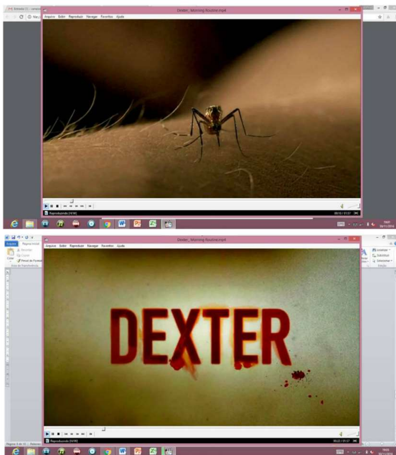
Figura 1: Composição de imagens da vinheta da série Dexter.

A vinheta começa com um mosquito mordendo o braço do personagem principal, Dexter. Ele dá um tapa e esmaga o inseto, em seguida aparece metade de seu rosto. Esse pequeno ato já é brutal, e deixa espaço para o que mais está por vir. Na sequência aparece o frame com o nome da série.