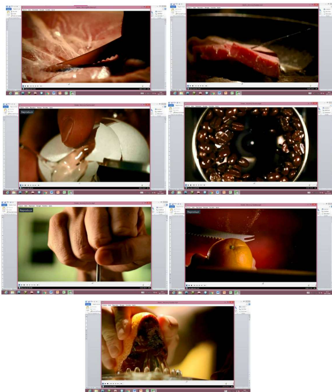
Figura 3: Composição de imagens da vinheta de abertura da série Dexter.

sugerem respingos de sangue no prato, junto aos alimentos. A forma como o detalhe do enquadramento reproduz a ação dá a ela uma dimensão de maior brutalidade.