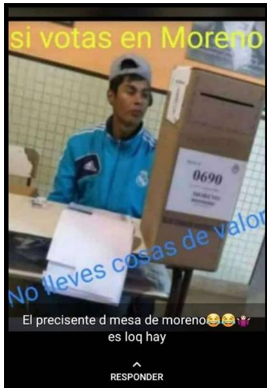
Ilustración 1 Origen del caso.