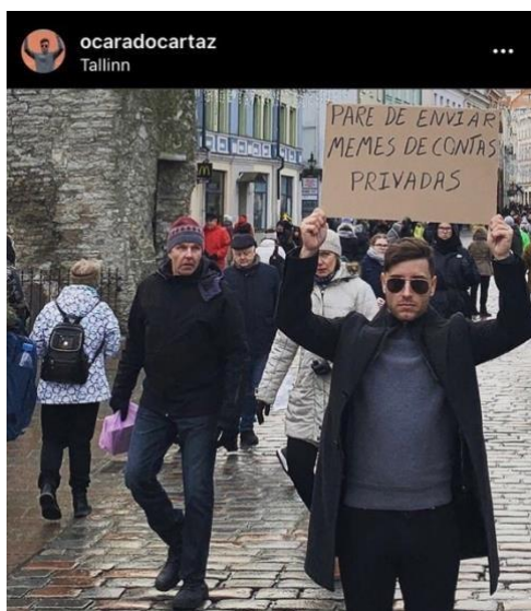
Image 2: First publication of the @dudewithsign profile, in October 2019

Image 1: First publication of the @ocaradocartaz profile, in January 2020