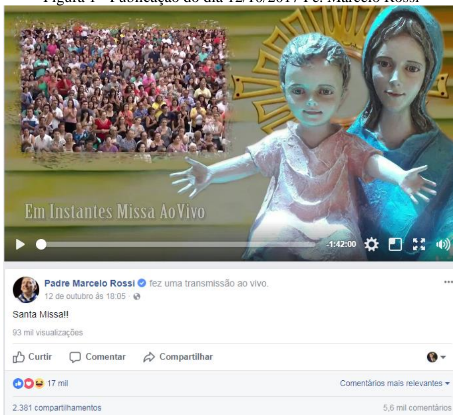
Figura 1 - Publicação do dia 12/10/2017 Pe. Marcelo Rossi

Fonte: Facebook Pe. Marcelo Rossi (2017) 3