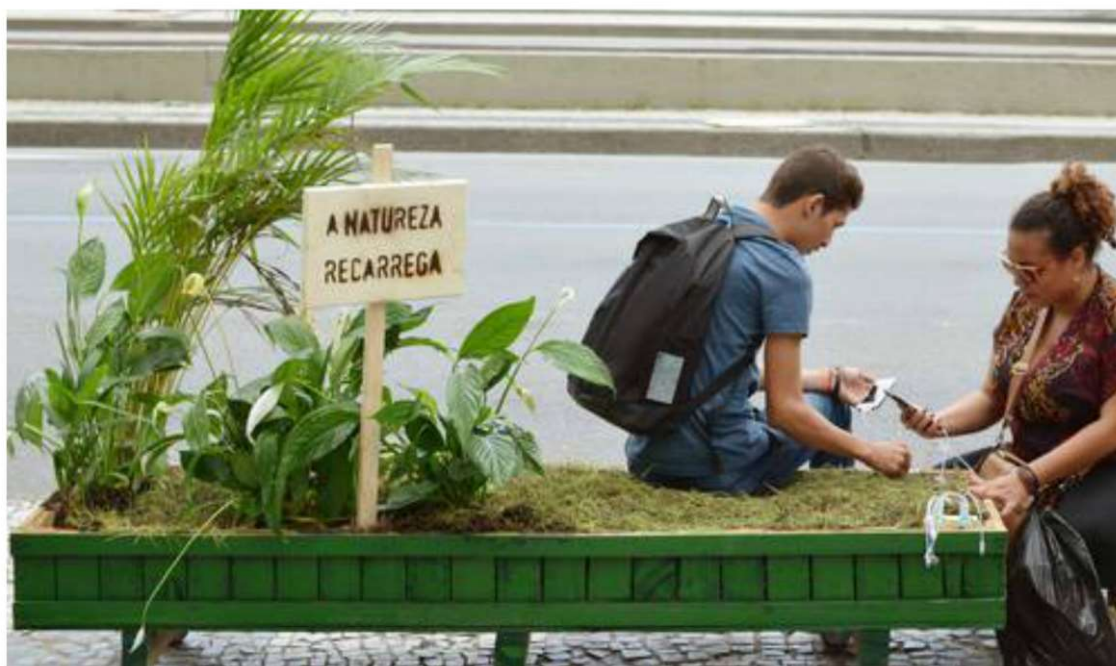
Figura 5: A natureza recarrega

A quinta ação analisada neste estudo chama-se “A natureza recarrega”. Trata-se de um carrinho móvel, em forma de jardim, com grama e algumas plantas verdes, onde a pessoa pode sentar. É uma ação simples. Embora existam os parques e as praças nas cidades, nem sempre os indivíduos têm tempo suficiente para frequentar estes espaços. E, muitas vezes, o contato com a natureza pode repor as energias necessárias para a rotina das pessoas, sobretudo aquelas que residem nas cidades grandes, cercados de muros e prédios cinzentos. Dentro deste carrinho móvel, existem, também, carregadores de celular. Ou seja, além de recarregar as energias do corpo, as pessoas, naquele momento, também podem recarregar seus aparelhos celulares.