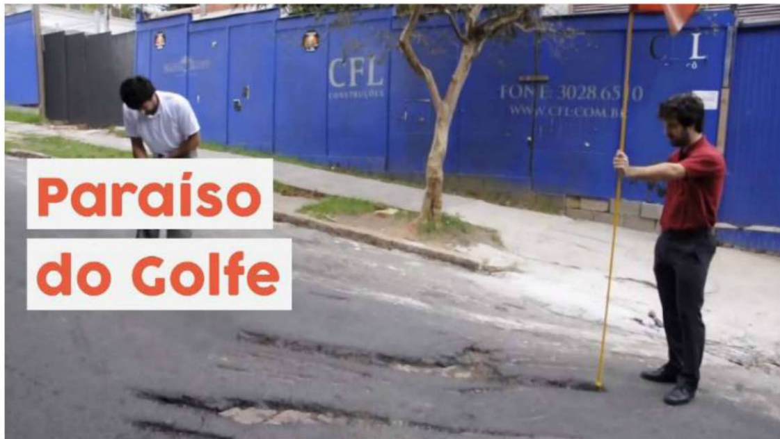
Figura 3: Paraíso do Golfe

Para mostrar o péssimo estado das ruas de Porto Alegre, o asfalto esburacado destas vias foi transformado em um grande campo de golfe. Como parte da ação, jogadores vestidos como golfistas, carregando tacos e bolas de golfe de verdade, caminhavam por ruas dos bairros mais nobres da cidade jogando golfe nos buracos do asfalto. O vídeo, que mostrava a ação “Paraíso do golfe”, viralizou rapidamente, especialmente com o apoio dos moradores da cidade ao projeto. Como consequência da ação, a Prefeitura de Porto Alegre decidiu tapar todos os buracos que apareciam no vídeo.