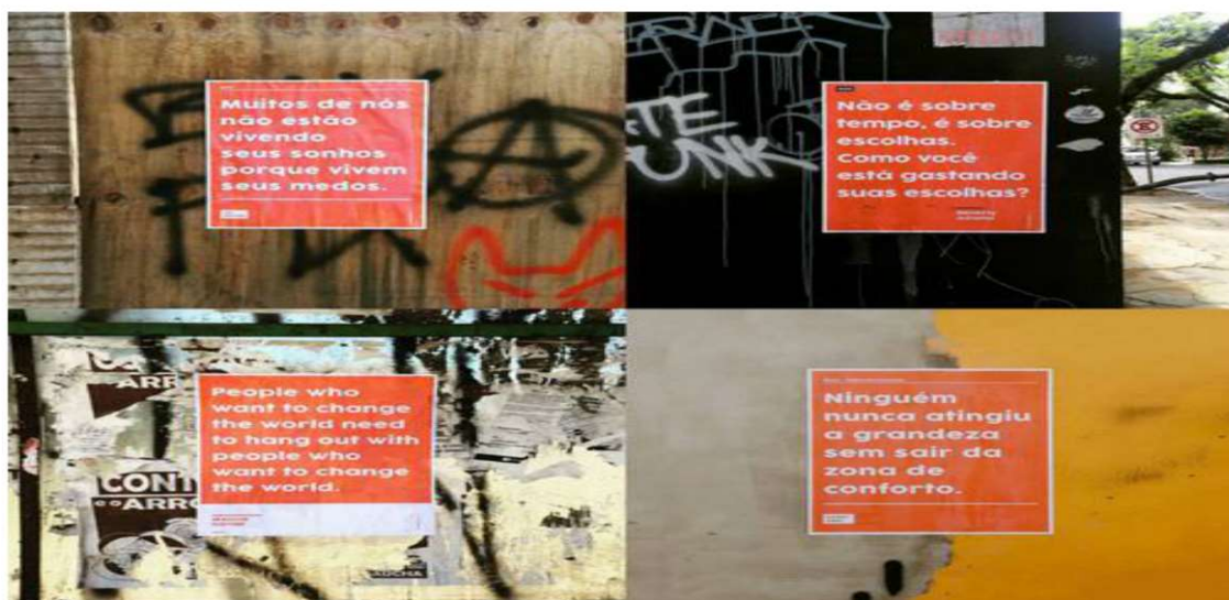
Figura 4: Dorme com essa

A quarta ação, chamada “Dorme com essa”, é uma coleção de frases cujo objetivo é espalhar questionamentos pelos muros, postes e tapumes na cidade. São frases de pessoas famosas que tratam sobre diversos assuntos: empreendedorismo, coragem, atitude. Elas servem como estímulo para as pessoas em um ambiente urbano que, como afirma Canevacci (1993), mescla percepções, ao mesmo tempo, de imundícies e de êxtases, de atrações e de repulsões. Toda semana, são coladas novas frases.