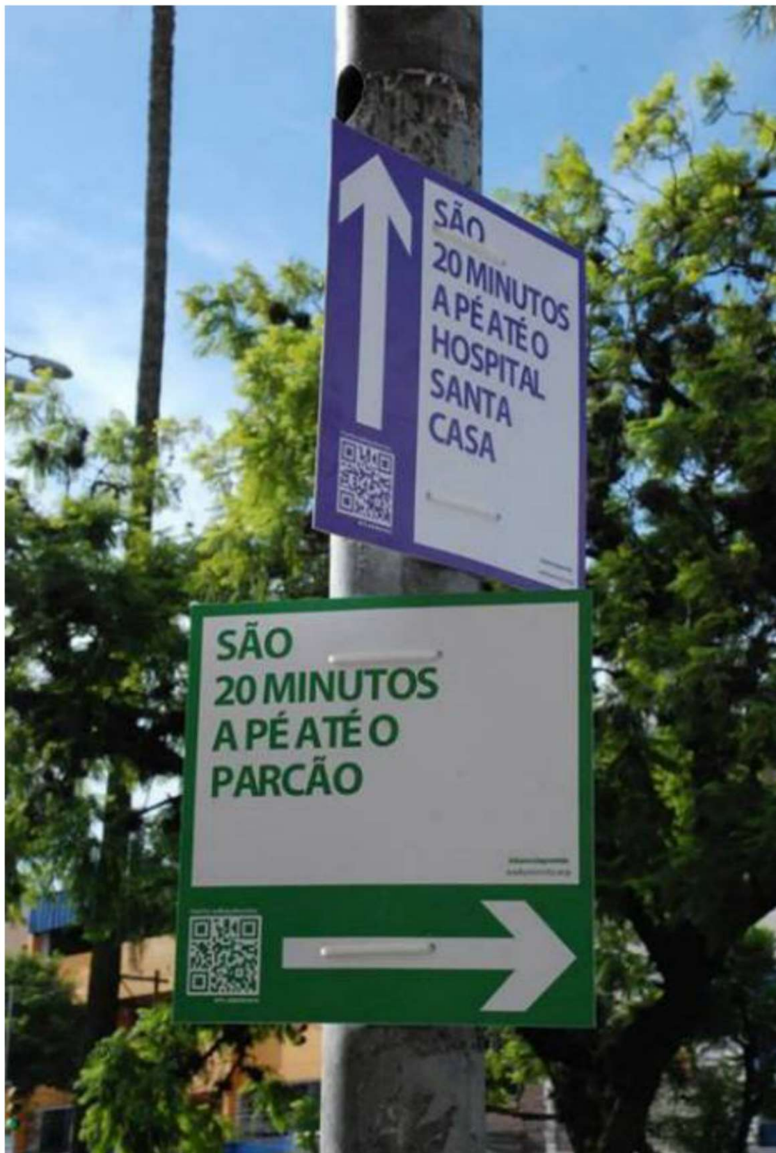
Figura 2: Passo a passo

A segunda ação, “Passo a passo”, é um projeto de sinalização para informar a distância a pé até os principais pontos de Porto Alegre.