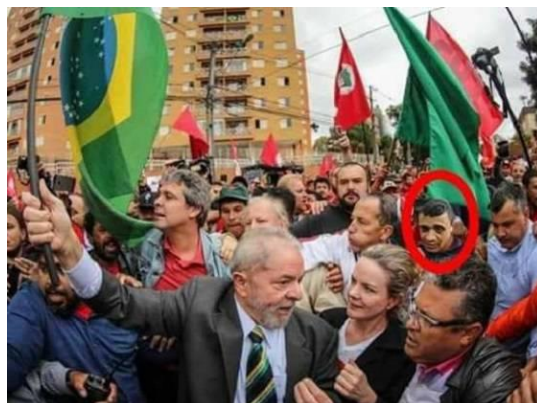
Figura 3: montagem

Dentro do contexto de campanha eleitoral houve uma tentativa de transformar o atentado em crime com motivação política, para prejudicar a campanha de Fernando Haddad, nesse caso as informações se enquadram na classificação de desinformação, segundo o Manual da Unesco, por apresentar um falso contexto no que diz respeito a falsa filiação de Adélio Bispo ao partido dos trabalhadores, e de conteúdo fabricado por conta da manipulação de fotografias ao lado de Lula, as ligações de Manuela para Adélio que não aconteceram. De mal informação, quando atende a característica do incentivo ao discurso de ódio, quando se coloca o atentado sendo motivado por divergência ideológica.