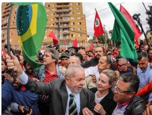
Figura 2: imagem original de Lula