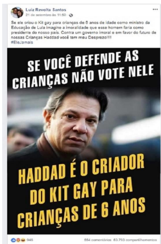
Figura 1: A informação que

Haddad era criador do “kit gay” circulava no Facebook.