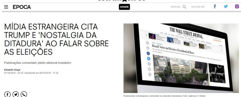
Figura 2. Amostra de como o pleito repercutiu nos meios de comunicação estrangeiros