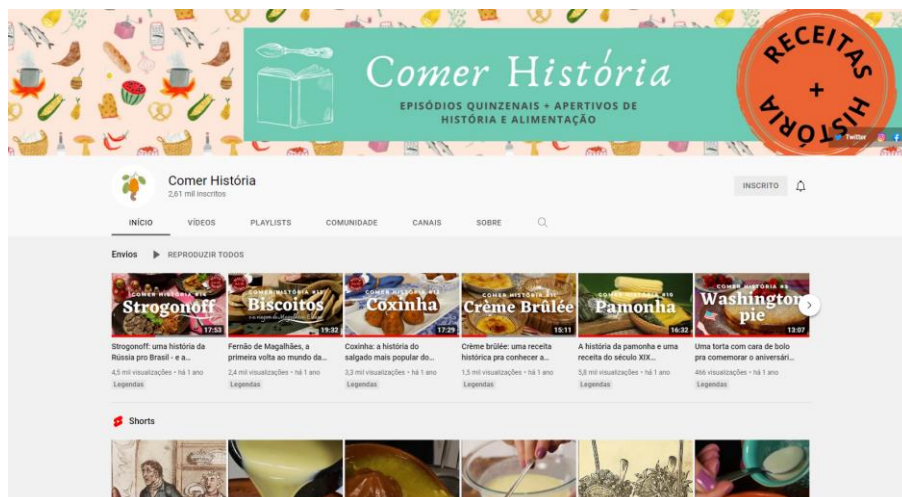
Figura 2 - Página inicial do Canal Comer História

Fonte: https://www.youtube.com/channel/UCpmJhHre2_DasXy-fTowK4w